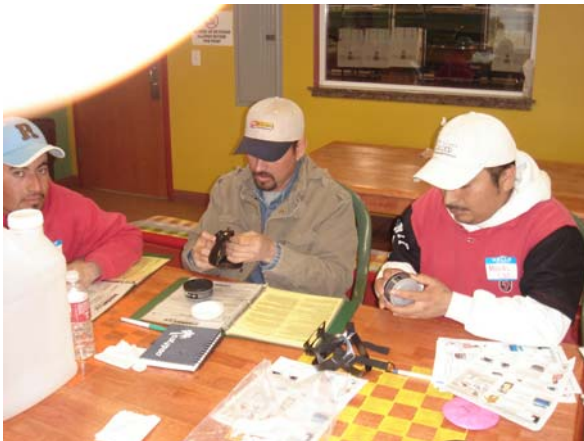
Varios participantes aprenden como ensamblar e inspeccionar el respirador durante uno de los ejercicios del Módulo de Protección Respiratoria del Taller de Entrenamiento Práctico para Aplicadores.

Es uno de los talleres que ofrece el WSDA para dar entrenamiento a los trabajadores sobre seguridad en el uso de pesticidas, de una manera relevante y efectiva, bajo el enfoque de “aprender haciendo”. Este tipo de entrenamiento minimiza importantes barreras, tales como el bajo nivel escolar.